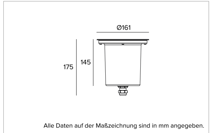
Alle Daten auf der Maßzeichnung sind in mm angegeben.